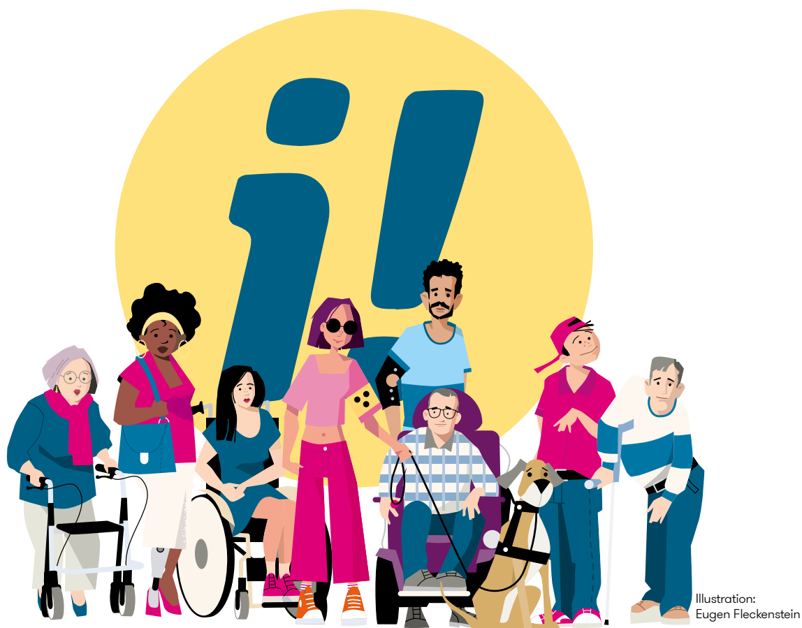
Illustration: Eugen Fleckenstein